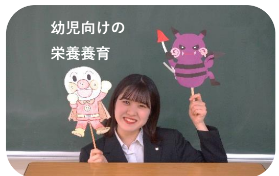
幼児向けの 栄養養育

A.班の代表者が立てた献立を班で相談しながら調理する実習が印象に残っています。ほとんどの実習では用意された献立を全班同じように調理することが多いので、とても新鮮で、新しい気づきや周りから学ぶことも沢山ありました。